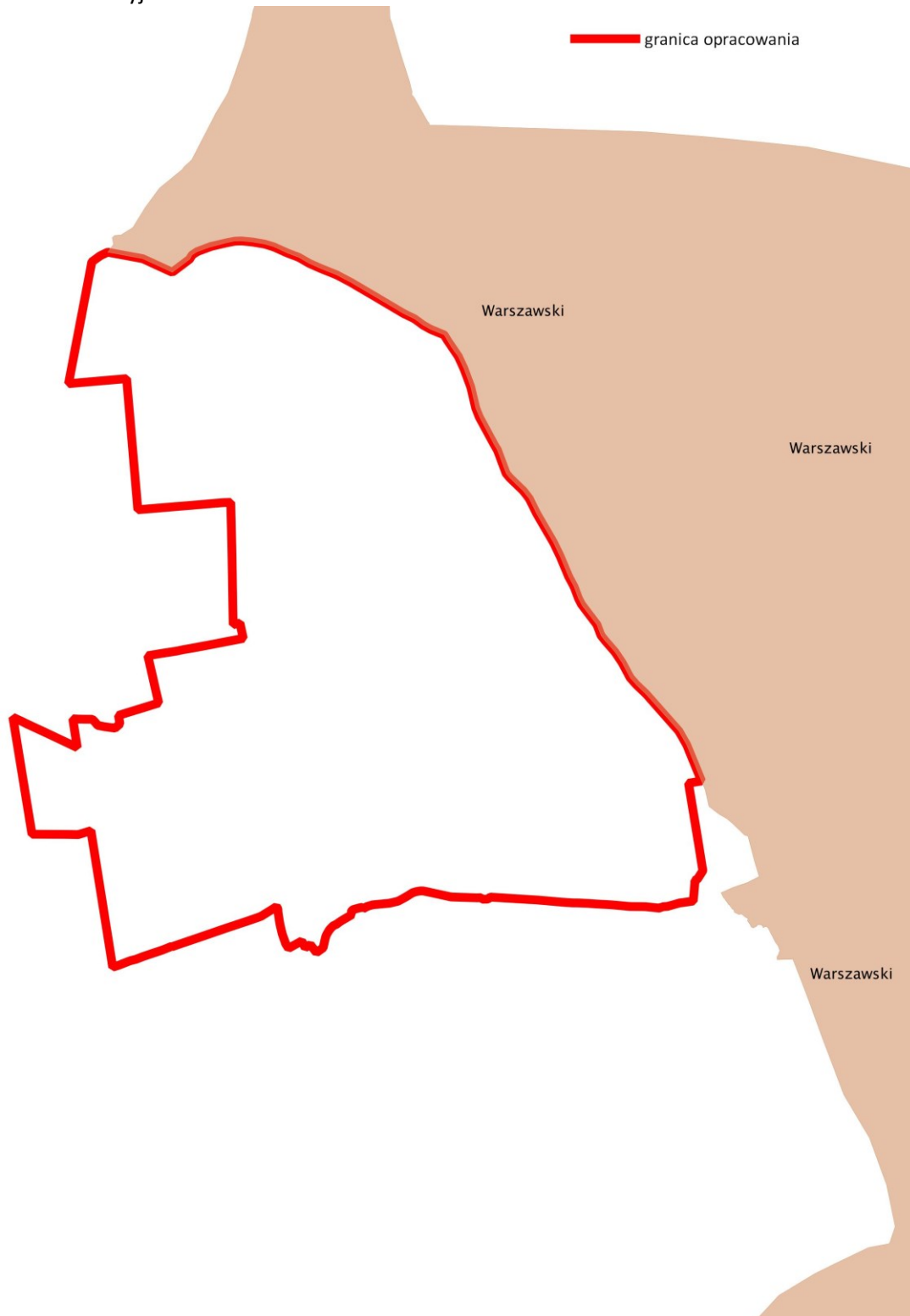
Rys. 2 Położenie terenu opracowania na tle Obszarów Chronionego Krajobrazu

W granicach opracowania, jak również w jego najbliższym otoczeniu nie występują takie formy ochrony przyrody jak zespoły przyrodniczo-krajobrazowe, użytki ekologiczne i stanowiska dokumentacyjne.