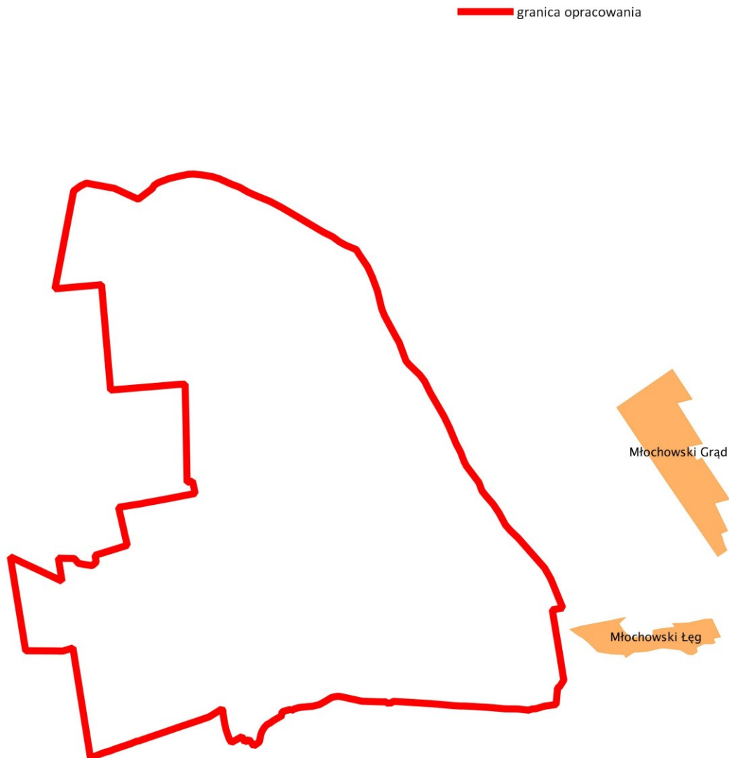
Rys. 1 Położenie terenu opracowania na tle rezerwatów przyrody

W granicach opracowania, jak również w jego najbliższym otoczeniu nie występują takie formy ochrony przyrody jak zespoły przyrodniczo-krajobrazowe, użytki ekologiczne i stanowiska dokumentacyjne.