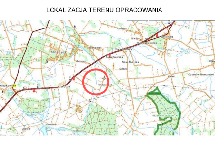
LOKALIZACJA TERENU OPRACOWANIA