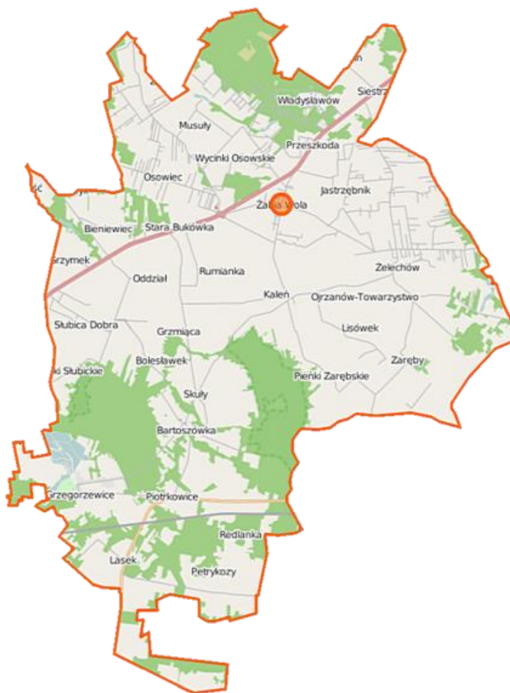
Rysunek 2. Mapa gminy Żabia Wola

Obszar gminy Żabia Wola jest dogodnie położony pod względem komunikacyjnym. Przebiega przez niego droga ekspresowa S8, która umożliwia szybki dojazd do Warszawy (37 km do centrum stolicy). Aktualnie oddane do użytku odcinki trasy S8, łączą takie miasta jak Wrocław, Sieradz, Piotrków Trybunalski, Warszawa czy Białystok.