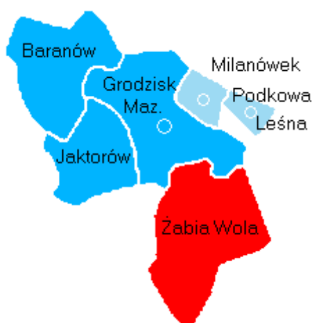
Rysunek 1. Gmina Żabia Wola na tle powiatu grodzkiego

Na terenie Gminy Żabia Wola zlokalizowane są atrakcyjne obszary inwestycyjne (ok. 140 ha) położone w bezpośrednim sąsiedztwie drogi krajowej nr 8 relacji Warszawa – Wrocław w miejscowościach: Siestrzeń, Przeszkoda, Żabia Wola, Nowa i Stara Bukówka. Na terenach tych można lokalizować obiekty usług użyteczności publicznej związane z obsługą handlu: sklepy, hurtownie, budynki biurowe a także składy, bazy i zaplecza oraz inne obiekty usługowe, których uciążliwość nie wykracza poza granice działki.