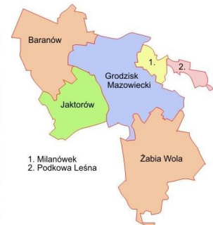
Ryc.1 Orientacyjna lokalizacja terenu opracowania w centralnej części gminy Żabia Wola, w powiecie grodziskim