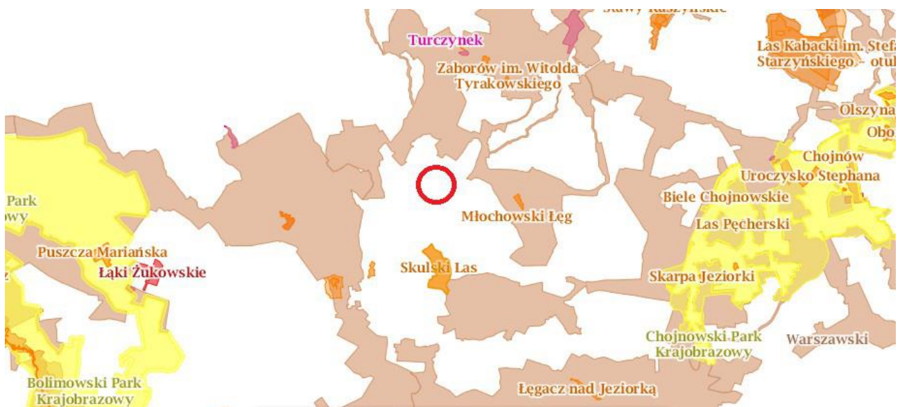
Ryc.3 Położenie terenu opracowania względem obszarów chronionych

W granicach planu nie znajdują się obszary prawnie chronione. Najbliżej zlokalizowanym obszarem podlegającym ochronie jest położony w odległości ok. 2,0 km na północ Warszawski Obszar Chronionego Krajobrazu.