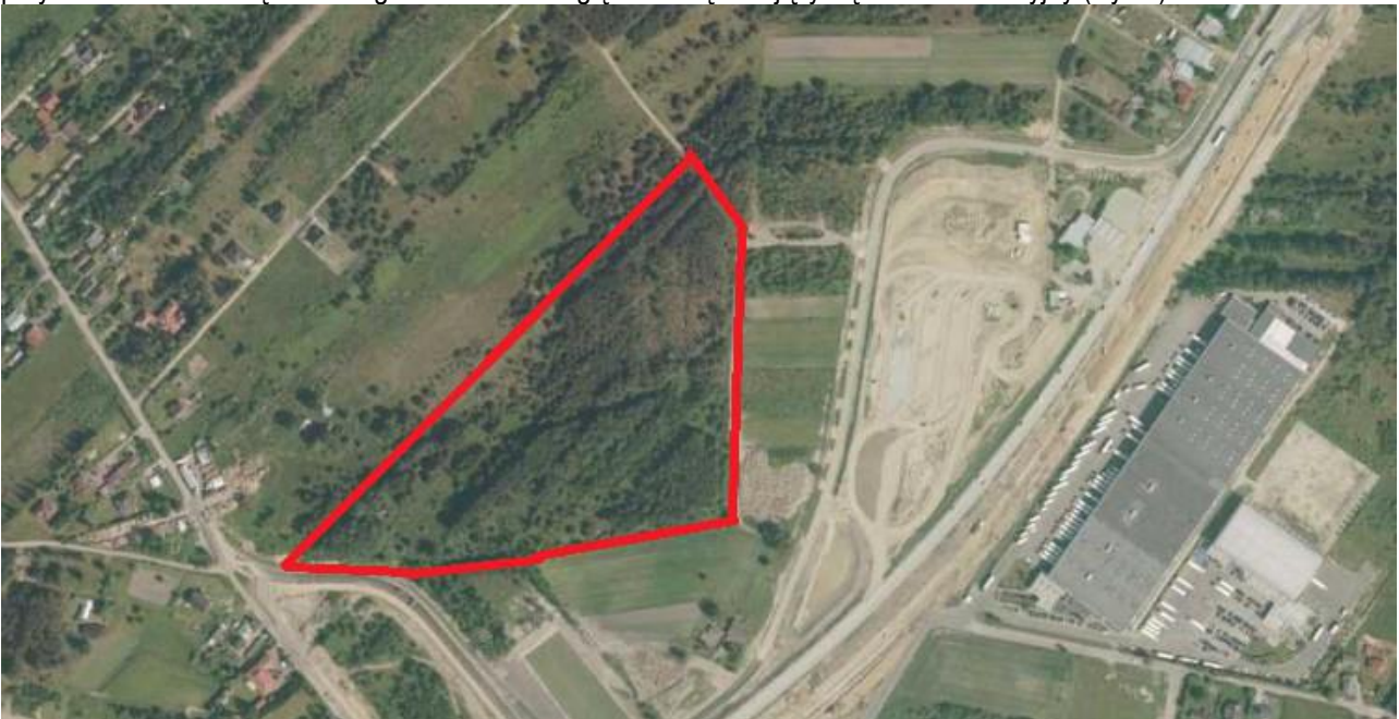
Ryc.3. Zdjęcie satelitarne z naniesioną granicą opracowania

Obszar opracowania odznacza się brakiem istotnych walorów przyrodniczych i krajobrazowych. Zasoby przyrodnicze terenu są mocno ograniczone ze względu na sąsiadujący węzeł komunikacyjny (Ryc.3).