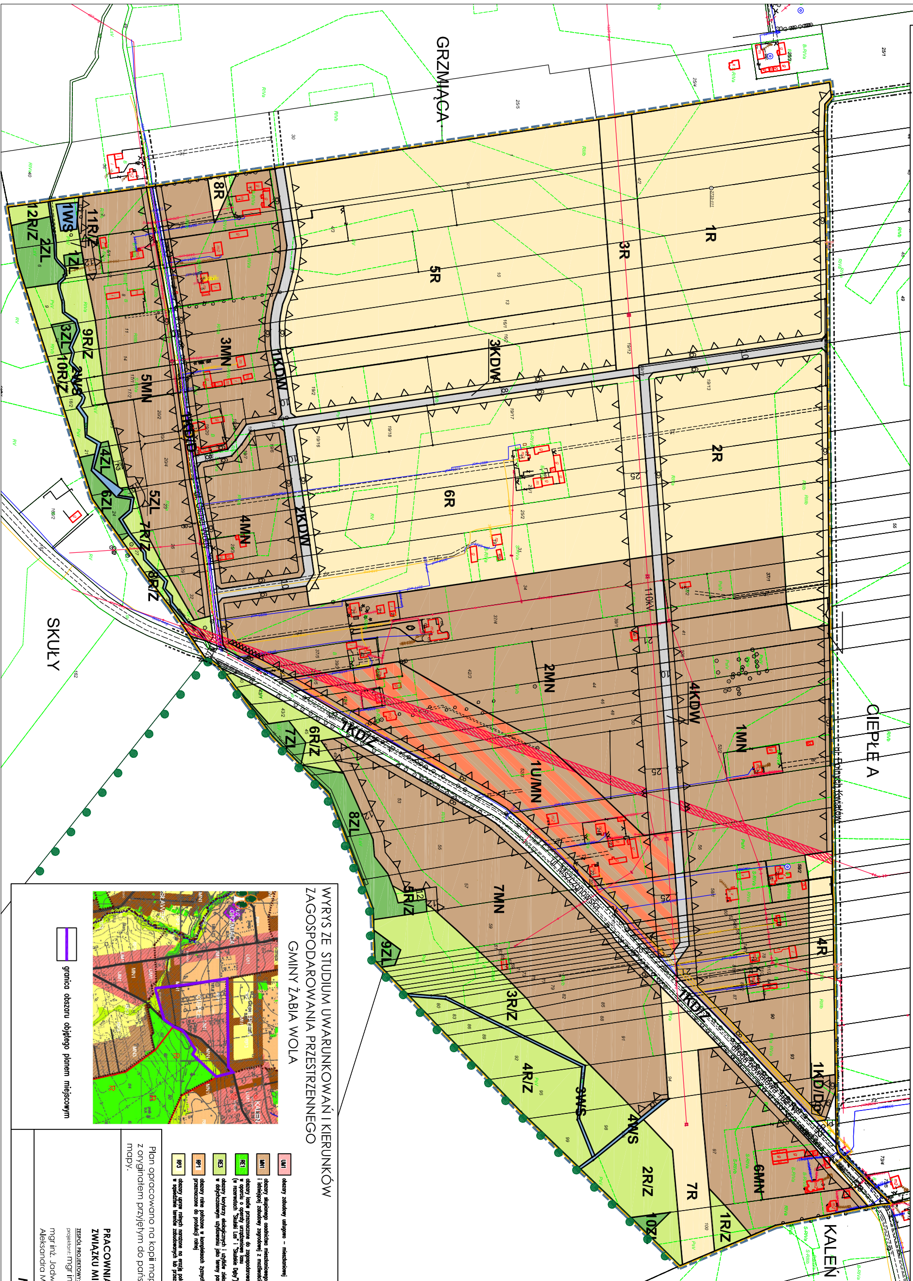
OZNACZENIA BĘDĄCE USTALENIAMI PLANU